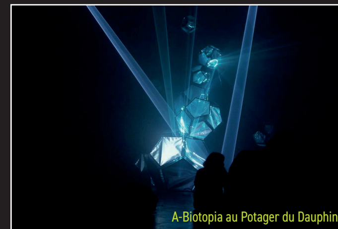
A-Biotopia au Potager du Dauphin

Programmeur du premier festival Archimérique, Gymkhana s'est vu confier l'animation du plan d'eau de la résidence Le Parc. Pour ses 60 ans, le plan d'eau de cette résidence classée au patrimoine du XXI e siècle, sera illuminé par une installation mélangeant projection et technologie LED. En jouant avec les reflets, l'artiste révélera les mouvements de l'eau et la géométrie du bassin.